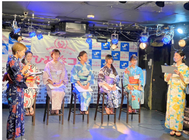
もりやま卑弥呼コンテスト