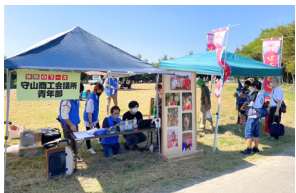
びわこ地球市民の森のつどい