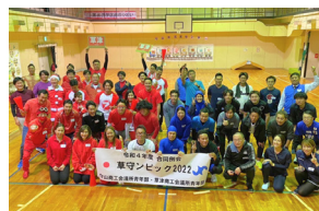
守山草津合同例会