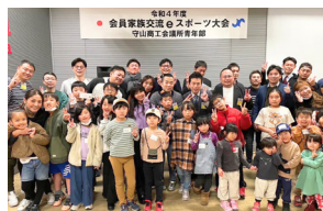
会員家族交流例会