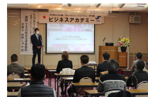
ビジネスアカデミー