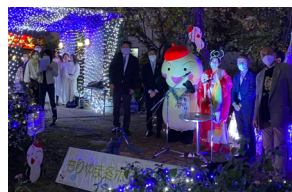
もりやま冬ホテル点灯式