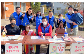
モリイチスタンプラリー